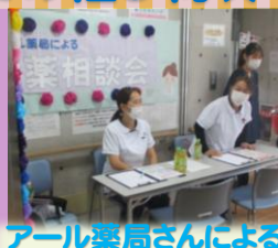
アール薬局さんによる お薬相談会