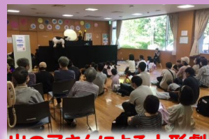
山の子さんによる人形劇