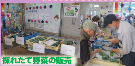
採れたて野菜の販売