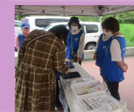
野庭団地地区環境事業 推進連絡協議会による啓発