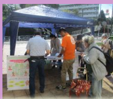
港南ひまわりプラン啓発