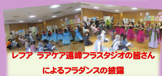
レファ ラアケア遠峰フラスタジオの皆さん によるフラダンスの披露